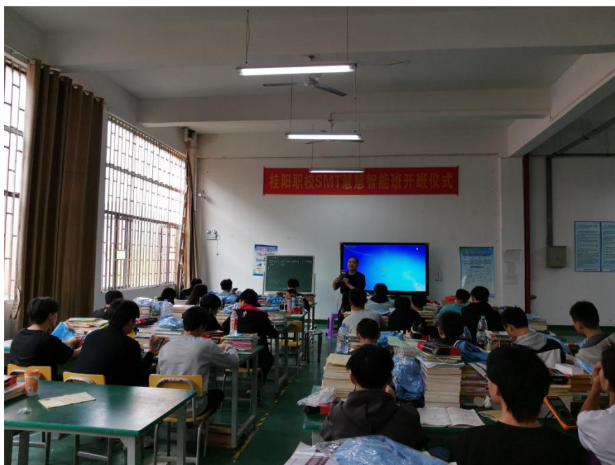
(学生正在专心致志的听企业工程师讲设备原理)

二、相同专业学生，在学生实际操作能力讲参与“现代学徒制”的学生比不参与“现代学徒制”的学生，实际操作能力更好。在“现代学徒制”学生在在校专业老师、企业工程师的教导下更精于设备的实际操作，动手能力得到近一步提升。