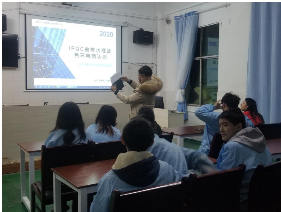
(学生正在专心致志听学校专业老师讲理论知识)

一、参与“现代学徒制”的学生学习兴趣得到提升，更加注重理论知识的学习。进入中职学校的学生理论知识普遍比较低，对理论知识的学习兴趣不浓厚，通过“现代学徒制”学生首先通过实物认识了解职位、了解设备工作原理，提升了对理论的兴趣，再通过实际对设备的操作学习兴趣得到巩固。