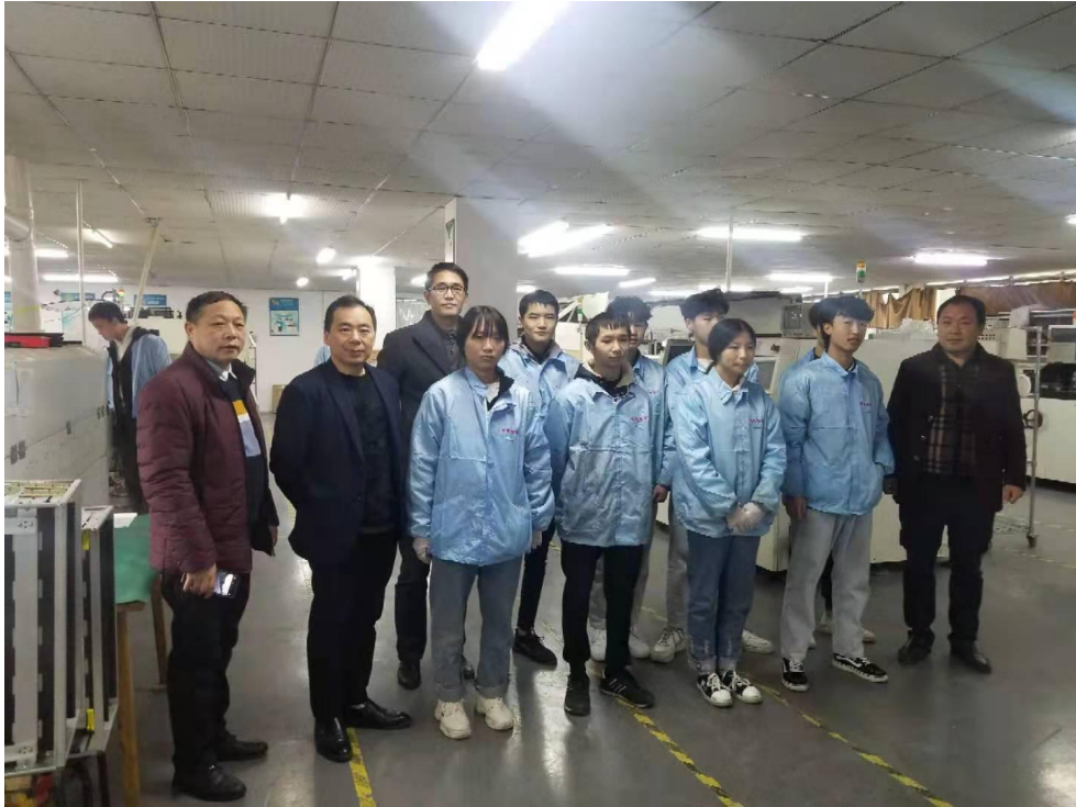
(学校领导现场调研“现代学徒制”学生，与学生代表合影)

三、参与“现代学徒制”的学生综合素质得到明显的提升，特别是对职业发展、企业运行与管理、人际交往能力，社会适应能力都有显著提升。