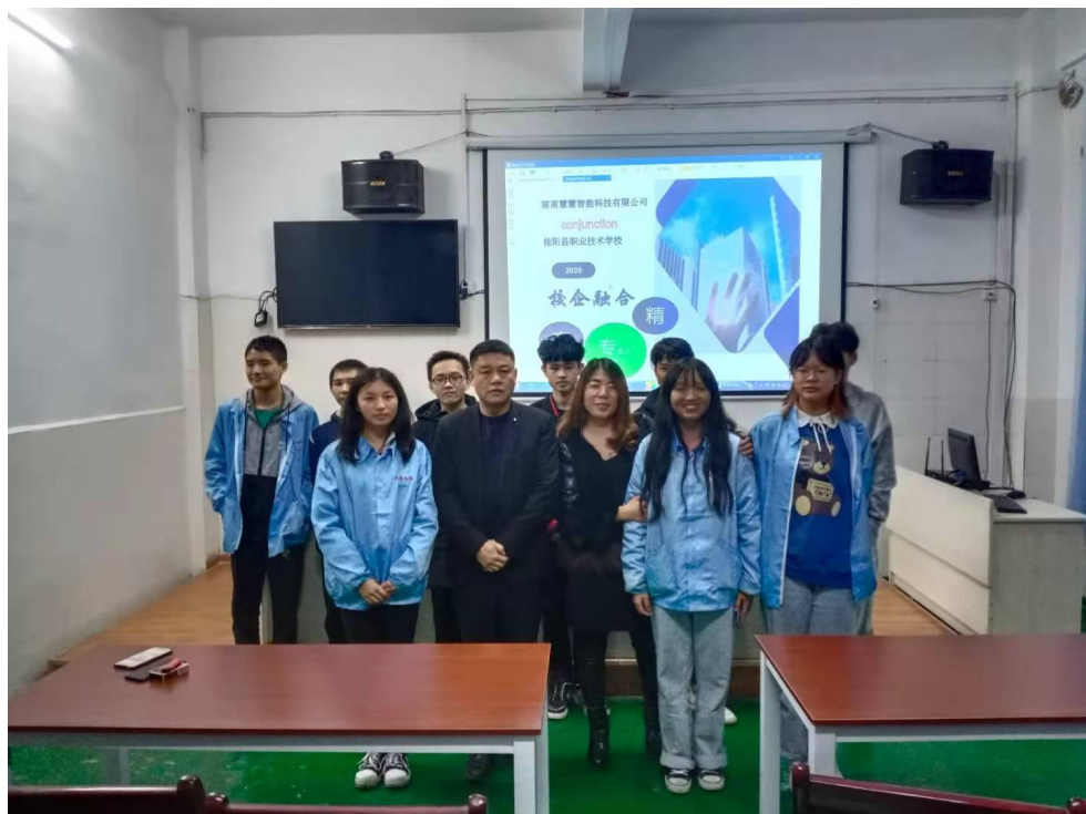
(公司领导与“现代学徒制”学生合影)